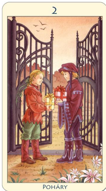
Tarot 78 Doors