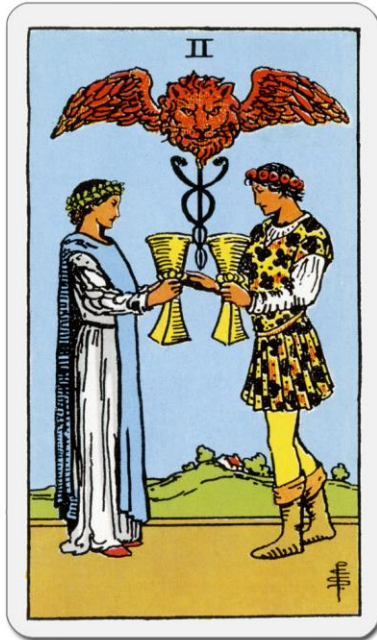
Rider Waite Tarot