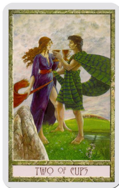
Tarot Magie Druidů

(C) Všechna práva autorů tarotových sad vyhrazena