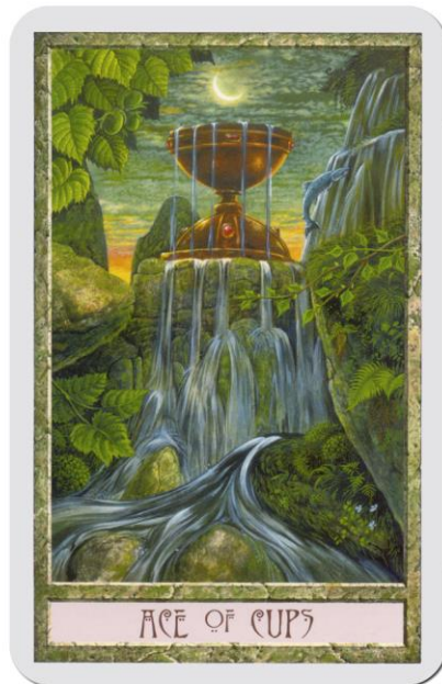
Tarot Magie Druidů

(C) Všechna práva autorů tarotových sad vyhrazena